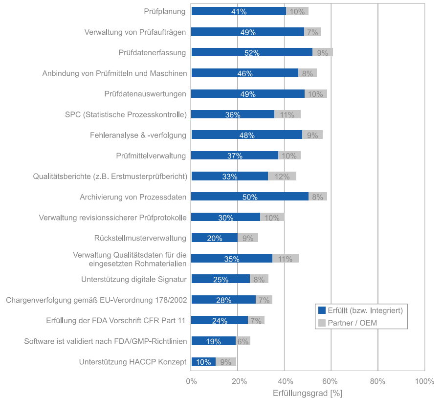
Abbildung 2: MES-Funktionen für das Qualitätsmanagement haben sich weiterentwickelt, sind aber längst nicht bei allen Lösungen im Standard enthalten 1

betrachteten Softwarelösungen bietet Funktionen zur Verwaltung von Prüfaufträgen sowie zur Prüfdatenerfassung und -auswertung. Nur ca. 40% unterstützen die Prüfplanung und 36% bieten Unterstützung bei der statistischen Prozesskontrolle (SPC). Schwächen weisen die betreffenden Softwarelösungen bei der Erstellung bestimmter Berichtsformate auf, wie z. B. Erstmusterberichte sowie bei der reversionssicheren, elektronischen Archivierung von Prüfprotokollen und Qualitätsberichten. Fordert ein Unternehmen diese Funktionalitäten, weil z. B. das belegmäßige Archiv abgelöst werden soll, kommen oftmals Partnerprodukte zum Einsatz. Ausgewählte Branchen, wie z. B. die Lebensmittel- und die Pharmaindustrie, unterliegen seit geraumer Zeit der Verpflichtung, ihre Produktions- und Qualitätssicherungsprozesse gemäß definierten Richtlinien zu dokumentieren. Funktionalitäten zur Erfassung und vorschriftsgemäßen Dokumentation der geforderten Daten bieten allerdings bisher nur relativ wenige der untersuchten MES-Lösungen.