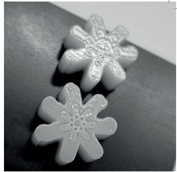
Biomimetische Gefäßstruktur während des additiven Prozesses.