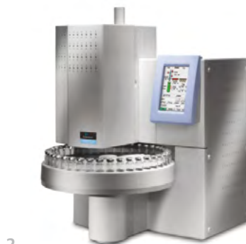
2 Headspace/Headspace Trap.