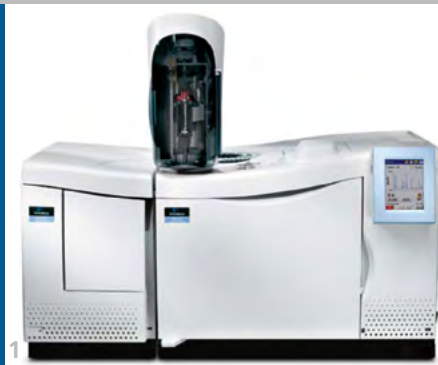
1 Gaschromatograph und Massenspektrometer.