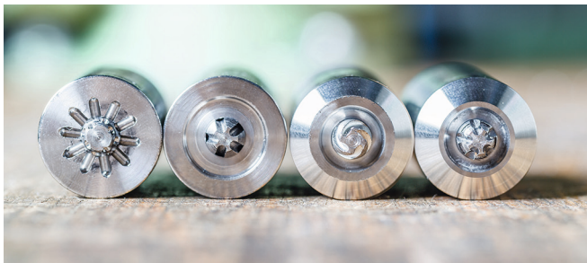
Auswahl von anforderungsspezifischen Rührreibschweiß-Werkzeugen.

Sein Abteilungskollege Manuel Schuster beschäftigt sich intensiv mit der Auswahl geeigneter Fügeverfahren von Multi-Material-Verbundwerkstoffen. Schuster weiß: »Der Verbindungstechnik kommt aus industrieller Sicht aufgrund der stetigen Steigerung des Einsatzes von Multi-Material-Design eine Schlüsselrolle zu.« Große Vorteile sieht er in der Kombination von Klebtechnologien und hybriden Fügeverfahren, insbesondere beim Rührreibschweißen. Das Verfahren soll sowohl auf Werkzeugmaschinen als auch am Arm eines Industrieroboters Anwendung finden.