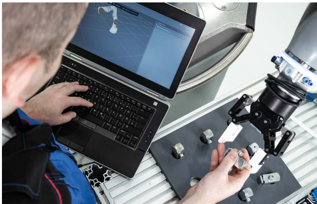
drag&bot in Aktion